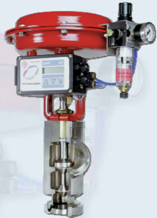
Leistungsbereiche Übersicht Capacity-Range Overview

Fischer Regelventile sind sehr einfach zu warten und haben eine lange Standzeit.